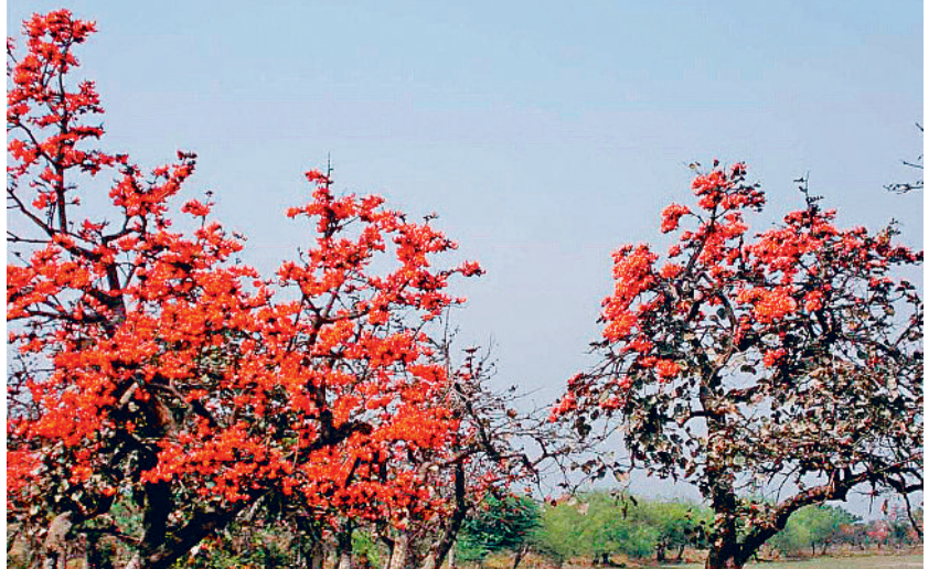
कवर्धा। अंचल में नजर आने लगे टेसू के रंग, दिखने लगी बसंत बहार।