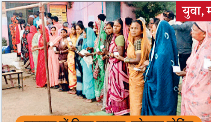
मतदान में दिखा उत्साह, जोरदार वोटिंग

त्रि-स्तरीय पंचायत चुनाव के तीसरे एवं अंतिम चरण का मतदान भी पूरा हो गया है। अविभाजित जिले की तीन जनपद में आयोजित इस अंतिम चरण में भी आपने गांव की सरकार चुनने प्रामोण्य वोटों ने जमकर उत्साह दिखाया। देर शाम तक जारी आंकड़ों के अनुसार लगभग 84 फीसदी मतदान इन जनपद में दर्ज किया गया। वहीं तीन बजे तक मतदान होने के बाद तत्काल मतगणना की प्रक्रिया भी शुरू कर दी गई थी। देर शाम ग्राम पंचायत के परिणाम भी सामने आने लगे। हालांकि प्रशासनिक स्तर पर अधिकारिक परिणामों की घोषणा 25 फरवरी को की जाएगी, लेकिन अपने एजेंट के सहारे जीत हार का आंकलन के बाद जीतने वाले प्रत्याशियों ने उत्साह भी मनाया शुरू कर दिया था। पहले दो चरण की तरह ही तीसरे चरण की 10 जिला पंचायत सीटों में भी भाजपा समर्थित प्रत्याशियों को अधिकांश सीटों पर बढ़त मिलती दिखाई दी।