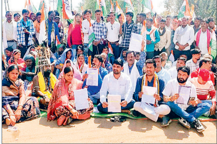
की प्रक्रिया पर रोक लगाई जाए। उन्होंने बताया कि इस संबंध में माननीय उच्च न्यायालय में मामला दायर किया गया है, अतः न्यायालय के निर्णय तक चुनाव परिणाम पर स्थगन प्रदान किया जाए।

कांग्रेस अधिकृत प्रत्याशी ने जिला निर्वाचन अधिकारी से मांग की है कि इन सभी बूथों की पुनः लिपिपत्र तथा परदर्शन दंगा से मतगणना कराई जाए, संपूर्ण चुनाव प्रक्रिया की लिपिपत्र जांच हेतु एक स्वतंत्र जांच समिति गठित की जाए, यदि किसी भी प्रकार की अनियमितता पाई जाती है, तो दोषी अधिकारियों/कर्मचारियों पर कानूनी कार्रवाई की जाए, न्यायालय में इस विषय की सुनवाई पूरी होने तक विजयी प्रत्याशी को प्रमाण पत्र जारी करने