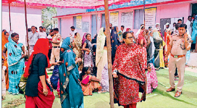
मतदान में दिखा उत्साह, जोरदार वोटिंग