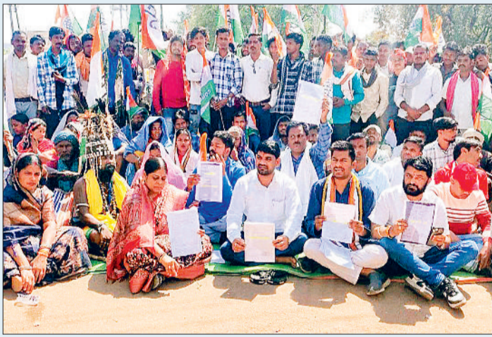
की प्रक्रिया पर रोक लगाई जाए। उन्होंने बताया कि इस संबंध में माननीय उच्च न्यायालय में मामला दायर किया गया है, अतः न्यायालय के निर्णय तक चुनाव परिणाम पर स्थगन प्रदान किया जाए।

कांग्रेस अधिकृत प्रत्याशी ने जिला निर्वाचन अधिकारी से मांग की है कि इन सभी बूथों की पुनः लिपिपत्र तथा परदर्शन दंगा से मतगणना कराई जाए, संपूर्ण चुनाव प्रक्रिया की लिपिपत्र जांच हेतु एक स्वतंत्र जांच समिति गठित की जाए, यदि किसी भी प्रकार की अनियमितता पाई जाती है, तो दोषी अधिकारियों/कर्मचारियों पर कानूनी कार्रवाई की जाए, न्यायालय में इस विषय की सुनवाई पूरी होने तक विजयी प्रत्याशी को प्रमाण पत्र जारी करने