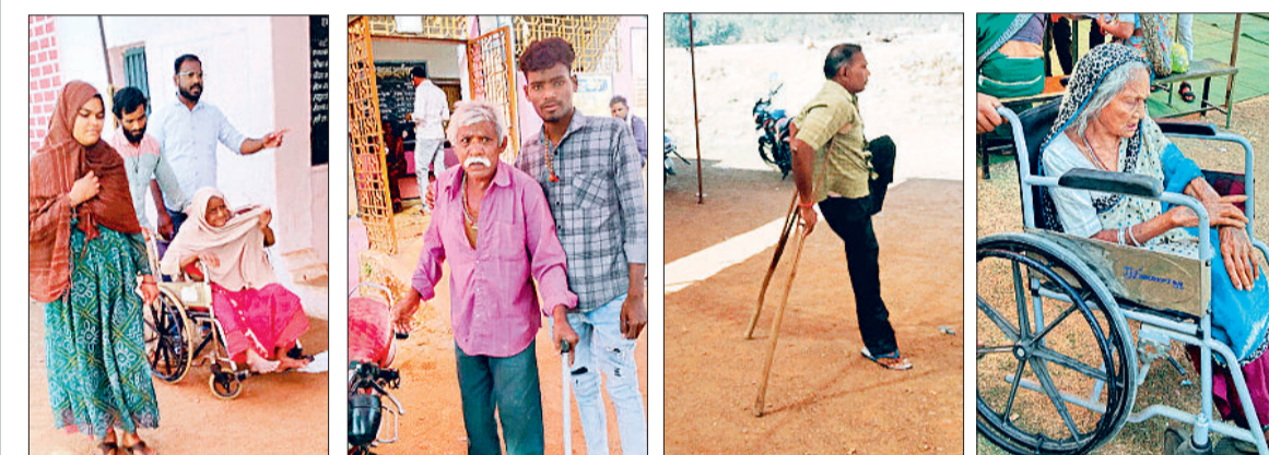
लोकतंत्र पर मरोसा जताते हुए तमाम परेशानियों के बाद भी इन लोगों ने बूथों में पहुंचकर अपने दायित्व का किया निर्वहन।