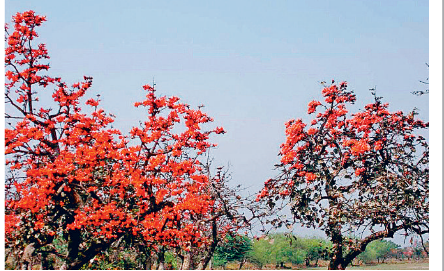
कवर्धा। अंचल में नजर आने लगे टेसू के रंग, दिखने लगी बसंत बहार।